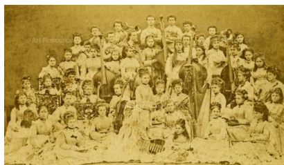
Figura 09 Artista: Sem autoria atribuída, séc. XIX. Obra: A primeira orquestra feminina na Europa, dirigida por Josephine Amann-Weinlich (Áustria), ca. 1870 . Técnica: Fotografia Localização: Áustria Referência: ART329696 Dimensões: 3744 x 2158 px