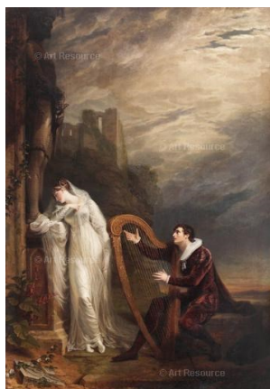
Figura 18 Artista: Dawe, George (1781-1829) Obra: Genevieve. 1812. Técnica: Óleo sobre Tela. Localização: Museu de Nova Zelândia, Wellington, Nova Zelândia. Referência: ART449449 Dimensões: 2152 x 3134 px Instrumento: Harpa