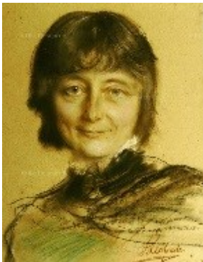
Figura 15 Artista: Lenbach, Franz von (1836-1904) Obra: Nina Hagerup esposa de Edward Grieg (1843-1907). Localização: Casa Edward Grieg, Nordas Lake, Bergen, Noruega. Referência: AA347112 Dimensões: 2025 x 2595 px