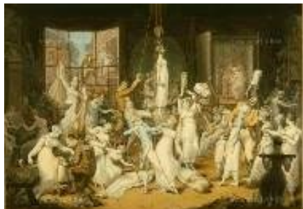
Figura 04 Artista: Burney, Edward Francis (1760-1848) Obra: Um estabelecimento para jovens senhoras elegantes. Técnica: Aquarela Referência: AA327811 Dimensões: 2525 x 1758 px Instrumento: Piano e Tamborim