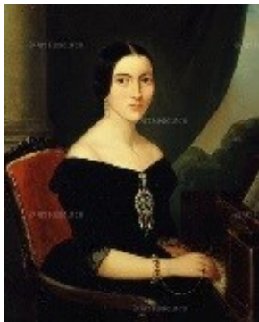
Figura 16 Artista: Sem autoria atribuída. Obra: Giuseppina Strepponi (1815-1897), soprano italiana. Localização: Museu do Teatro Scala de Milão. Referência: AA387943 Dimensões: 2353 x 2963 px