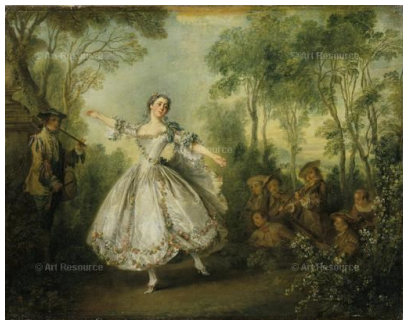
Figura 19 Artista: Lancret, Nicolas (1690-1743) Obra: Senhorita Camargo dançando. 1730. Técnica: Óleo sobre Tela. (41.7 x 54.5 cm) Localização: Coleção Wallace, Londres, Grã-Bretanha. Referência: ART396328 Dimensões: 5482 x 4347 px