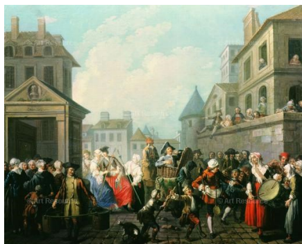
Figura 05 Artista: Jeaurat, Etienne (1699-1789) Obra: Carnaval nas Ruas de Paris, 1757. Localização: Museu Carnavalet Paris Referência: AA368819 Dimensões: 2100 x 2708 px Instrumento: Percussão e Flautim.