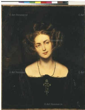
Figura 14 Artista: Delaroche, Paul (1797-1856) Obra: Henriette Sontag (1806-1854). Cantora alemã. Técnica: Óleo sobre Tela. (73 x 60 cm) Localização: Hermitage, St. Petersburg, Russia. Referência: ART71537 Dimensões: 4764 x 6048 px