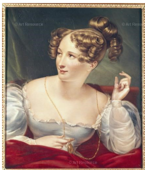
Figura 17 Artista: Sem autoria atribuída. Obra: Retrato da esposa de Hector Berlioz. Localização: Coleção Privada, Paris, França. Referência: ART42846 Dimensões: 6193 x 7243 px