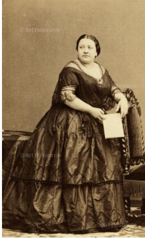
Figura 13 Artista: Disderi, Eugène (1819-1889) Obra: Marietta Alboni (1823-1894), ca. 1865. Contralto Italiana. Técnica: Fotografia Referência: ART329389 Dimensões: 2191 x 3598 px