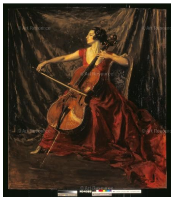
Figura 11 Artista: John, Augustus Edwin (1878-1971) Obra: Madame Suggia (1920-3) Técnica: Óleo sobre Tela. (1867 x 1651 mm) Localização: Galeria Tate, Londres, Grã-Bretanha. Referência: ART53582 Dimensões: 6716 x 7737 px Instrumento: Violoncello.