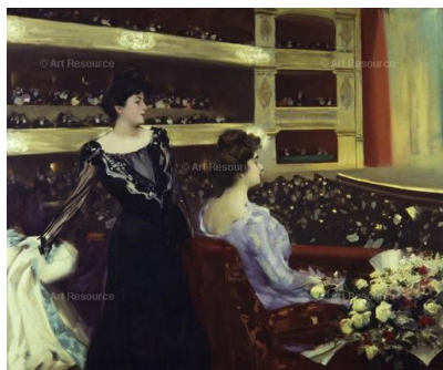
Figura 21 Artista: Sem autoria atribuída. Obra: O Teatro . 1902. Técnica: Óleo sobre Tela. Localização: Barcelona, Espanha. Referência: AR9156626 Dimensões: 5610 x 4648 px