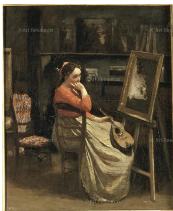
Figura 08 Artista: Corot, Jean-Baptiste Camille (1796-1875) Obra: Senhorita pensativa segurando Bandolim. 1865. Técnica: Óleo sobre Tela. (56 x 46 cm) Localização: Museu de Orsay, Paris, França. Referência: ART181839 Dimensões: 4096 x 4921 px Instrumento: Bandolim