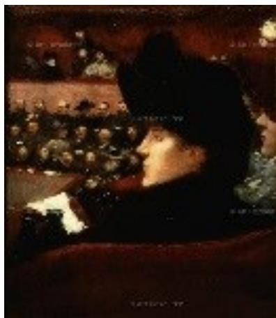
Figura 20 Artista: Forain, Jean Louis (1852-1931) Obra: O camarote. Localização: Museu Carnavalet Paris. Referência: AA380862 Dimensões: 2556 x 2945 px