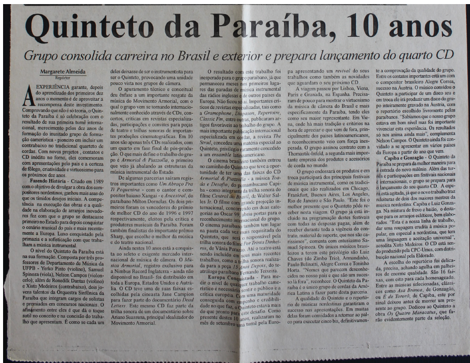
Figura 1: Divulgação dos dez anos do Grupo no jornal A União , João Pessoa, 10 de outubro de 1999.

Nesse caso, o teor informacional materializado na matéria de jornal, nos remete a primeira década da trajetória musical do Quinteto da Paraíba, como também, aponta significativos indícios da memória da produção musical Grupo. A publicação do jornal, assinada nos dez anos de atividades do Quinteto da Paraíba, um passado repleto de criatividade e virtuosismo, suficientes para garantir a produção musical do Grupo no presente e futuro. Hoje, o Quinteto da Paraíba presta a atingir três décadas em efervescente atividade, confirma-se os indícios descritos no jornal. O item documental propicia a articulação entre o passado, presente e futuro. Ou seja, o documento e/ou o arquivo permitem a articulação entre trajetória e memória do indivíduo e/ou grupo, posto que, a própria sociedade tem recorrido aos suportes exteriores para preservar suas lembranças. Tal configuração do arquivo é identificada no entendimento de Nora (1993), quando cita que,