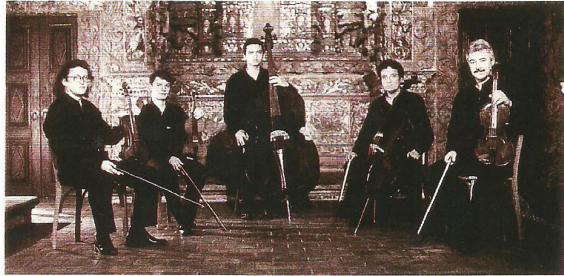
The Quinteto da Paraíba's rustic playing suits a lively selection of works by Brazilian composers

Villa-Lobos talked a lot about incorporating the folk material of his native Brazil into his music, but his works remained in large part European dishes locally spiced to taste. Only in the next generation, with composers such as César Guerra Peixe, who left São Paulo and serialism in the 1950s to head for the fertile region of the Brazilian northeast, did nationalist music take its first real step into the hinterland.