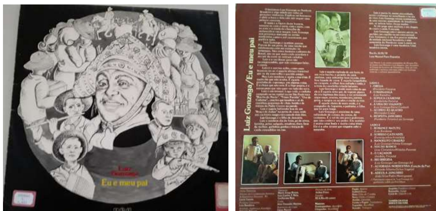
Figura 3 – Capa e contracapa do LP Eu e meu pai (12 polegadas) representativas do imaginário sociocultural do Sertão e da relação do compositor com seu pai.