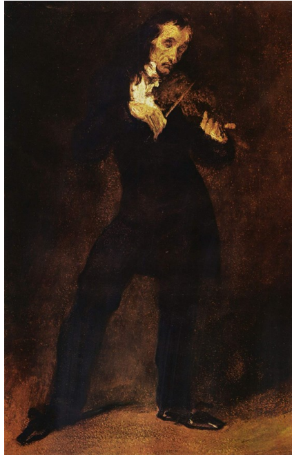
Fig.4 Paganini (1831/2) por Eugène Delacroix (1798-1863). Coleção Privada, Washington DC