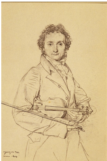
Fig.2 Paganini (Roma,1819), por Jean Dominique Ingrés (1780-1867). Louvre

Mesmo privando da amizade e confiança de Rossini, que o encarregou até mesmo de dirigir obras suas, e tendo já sido ovacionado nos principais teatros da Itália, em que se sobressai o Scala de Milão, Paganini teria que esperar até o sucesso da segunda turnê italiana (1825-27) para se impulsionar ao exterior. A esta altura, já havia um seu retrato feito por Ingrés.