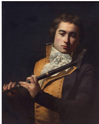
Fig 1. Portrait du flutiste François Devienne (ca.1792). atribuído a Jacques Louis David (1748-1825). Real Museu de Belas Artes, Bélgica

Ao final do século XVIII representações como a atribuída ao flautista François Devienne (1759-1803) por Jacques Louis David (1748-1825) mostravam uma casaca escura sobre roupa colorida, hábito que perdurou ainda pelas primeiras décadas do século XIX