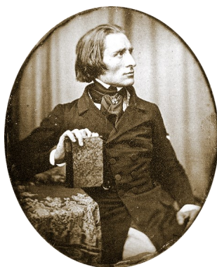
Fig. 7. Liszt (1843), fotografado por Herman Biow (1804-1850).

Neste período e cada vez mais, vestia-se de preto fechado, como Paganini, como a moda do tempo, mas lhe dando uma nova dimensão. Dispôs-se a tocar em todos os espaços e eventos para onde lhe chamavam; calcula-se que tenha dado em torno de 1000 concertos entre 1839 e 1847, de Portugal à Rússia, da Turquia à Irlanda, incansavelmente. Diversos destes concertos eram benemerentes e estavam associados a causas sociais e humanitárias, mas também em favor de artistas e sua memória, sempre com rendas revertidas, doadas e amplamente divulgadas. A imagem do diabólico, como disse Andersen, transformava-se na luz espiritual. Como Liszt era profundamente religioso (com a morte do pai veio a primeira séria intenção de entrar para um convento), essa luminosidade espiritual não podia ser outra senão divina.