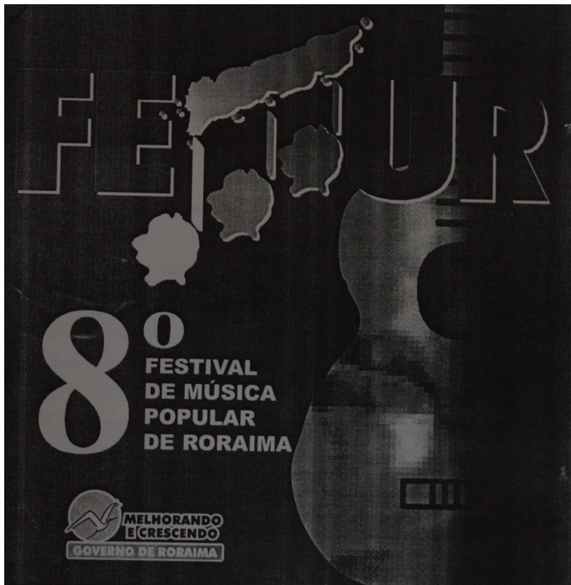
Figura 11 – 8º FEMUR

A figura 11 é um cartaz do 8º Festival de Música Popular de Roraima (FEMUR). A edição em questão ocorreu nos dias 14, 15 e 16 de dezembro de 1995, no Anfiteatro do Parque Anauá (LIMA, 1999, p. 42).