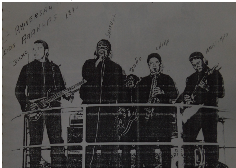
Figura 4 – Os Aranhas (1970)