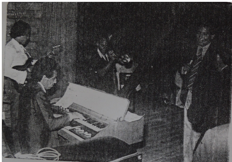
Figura 15 – Baile Comum