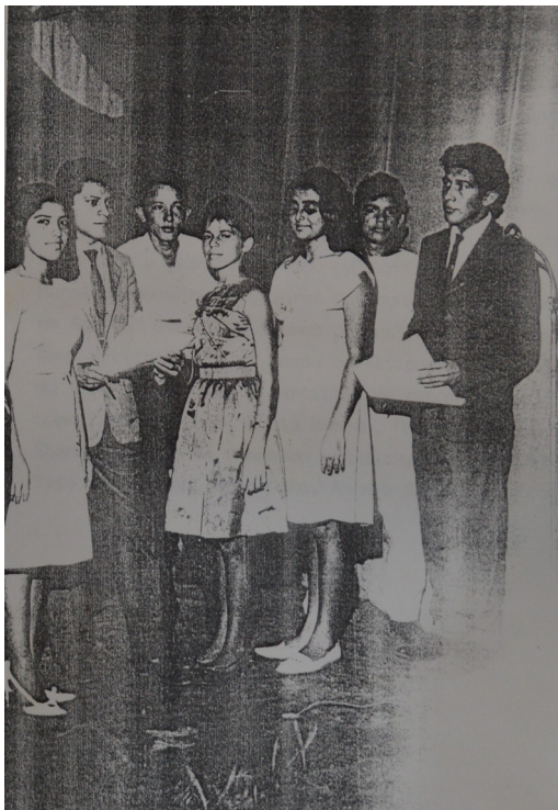
Figura 9 – Noite de Gala, Teatro Carlos Gomes (1965)