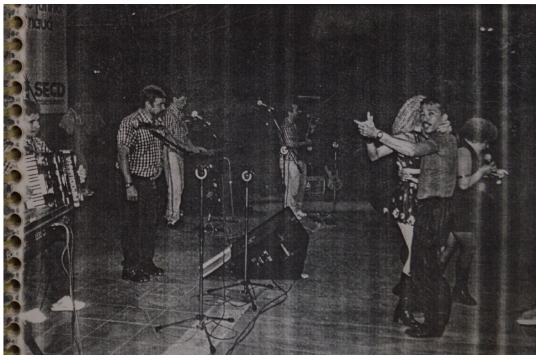
Figura 1 – Imagem da capa