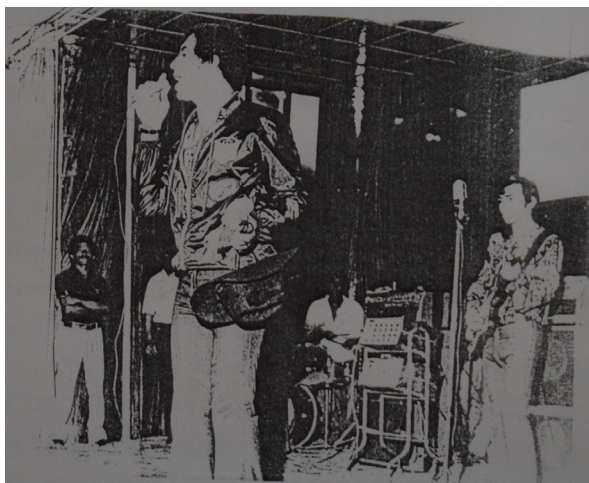
Figura 10 – Reginaldo Rossi e Golden Star