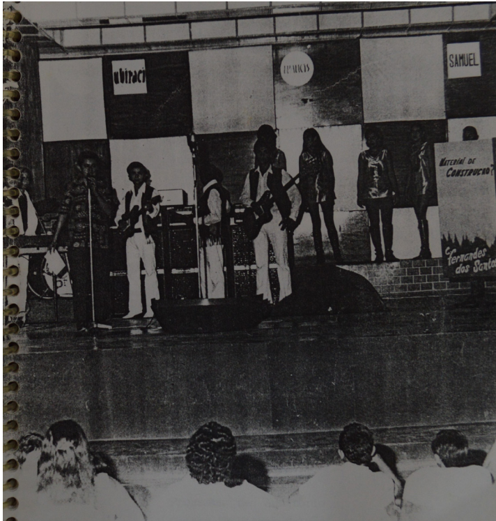
Figura 6 – Golden Star