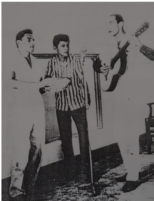
Figura 2 – Programa Encontro com a Saudade (1968)