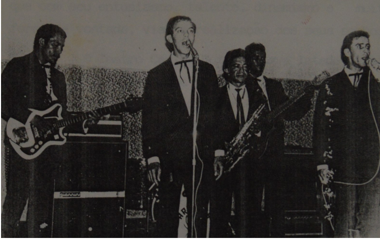
Figura 5 – Os Aranhas